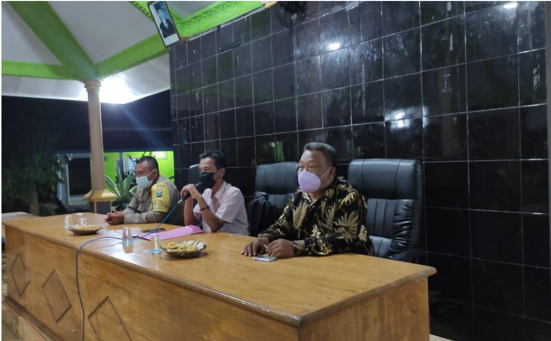
Dokumentasi Acara pembinaan RT – RW sekaligus sosialisasi kadarkum terkait Kamtibmas di lingkungan

Pentingnya Kamtibmas di wilayah Sidorejo karena untuk menjadikan wilayah Desa Sidorejo Aman dan Kondusif. Maraknya pencurian Hewan serta pencurian kendaraan bermotor menggugah kita untuk lebih waspada dan lebih peduli kepada lingkungan sekitar sehingga dapat meminimalisir kejadian serupa. Di setiap kegiatan acara pertemuan, rapat RT RW selalu disampaikan pentingnya menjaga Kamtibmas di lingkungan sekitar oleh Kepala Desa serta dikuatkan oleh Babinsa dan Babinkamtibmas wilayah Desa Sidorejo.