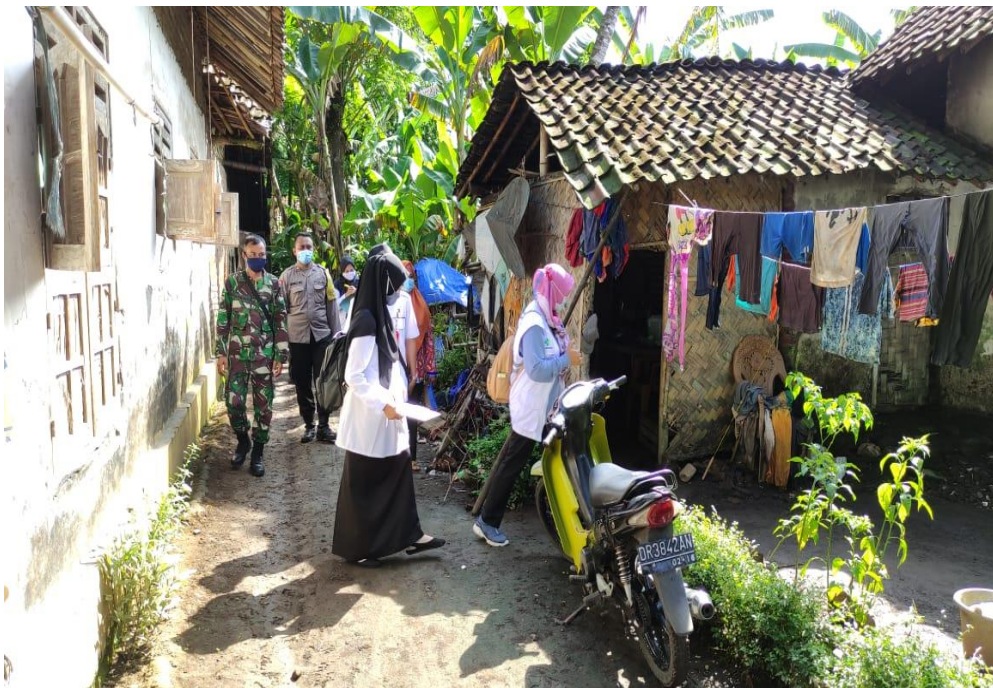
Pemeriksaan Jamban Sehat dilakukan oleh Tim Kesehatan Puskesmas dan didampingi Oleh Babinsa dan Babinkamtibmas Desa Sidorejo