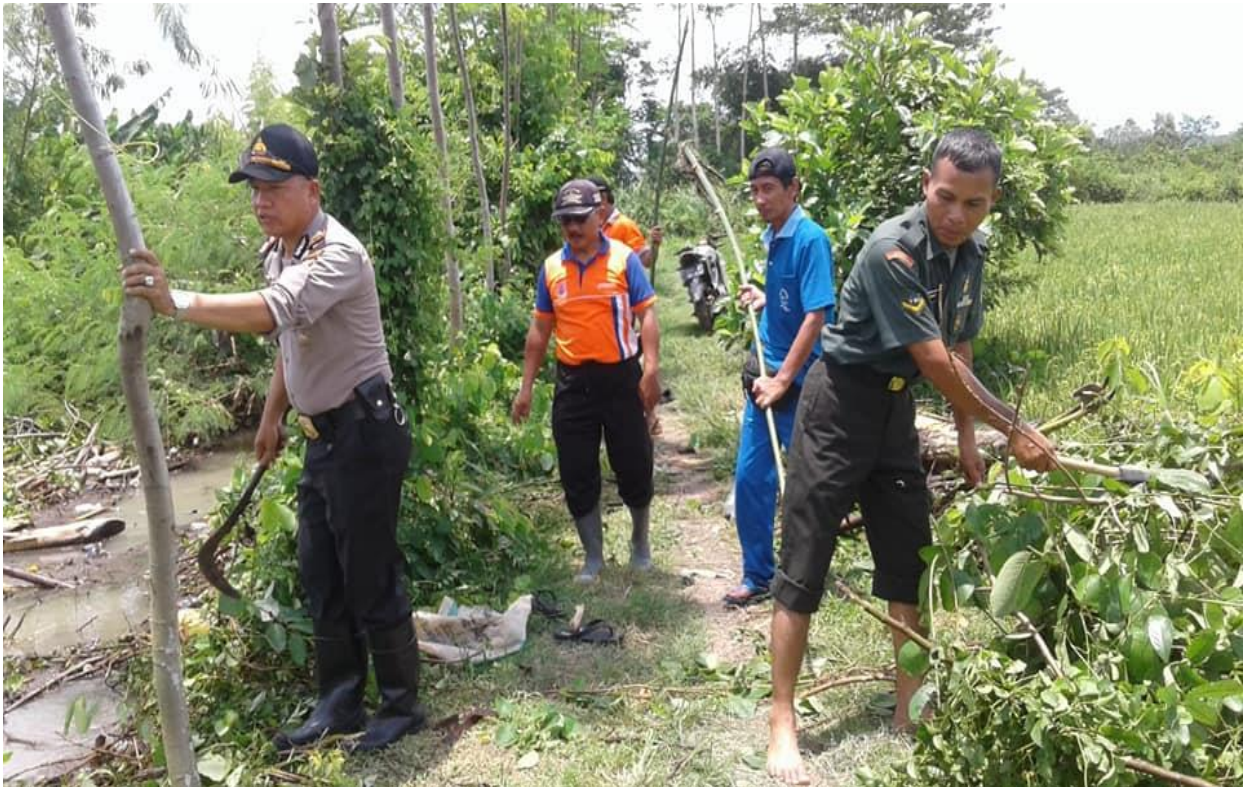
Suasana Kerja Bakti Pemerintah Desa, TNI Poleri dan masyarakat di Sungai Menjangan Mati Dusun Pepe Desa Sidorejo