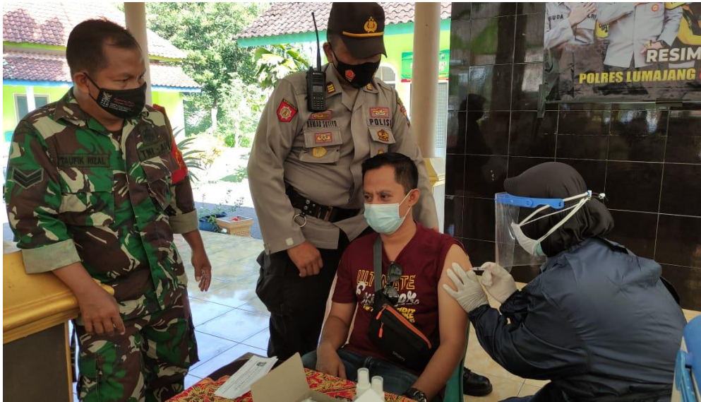
Vaksinasi Covid -19 di Balai Desa Sidorejo