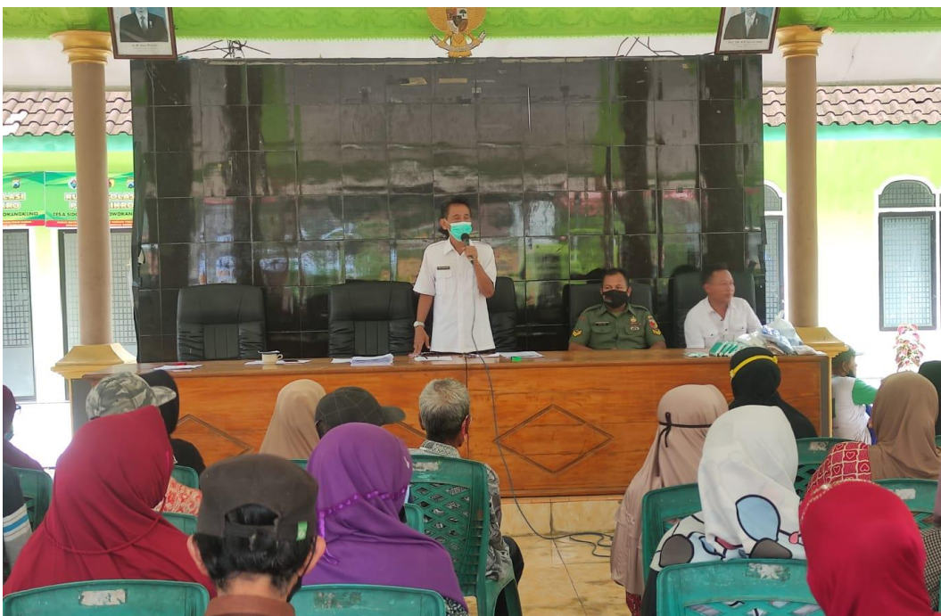
Pembagian BLT – DD dan pembagian masker gratis serta sosialisasi Sadar Kamtibmas bagi KPM Desa Sidorejo