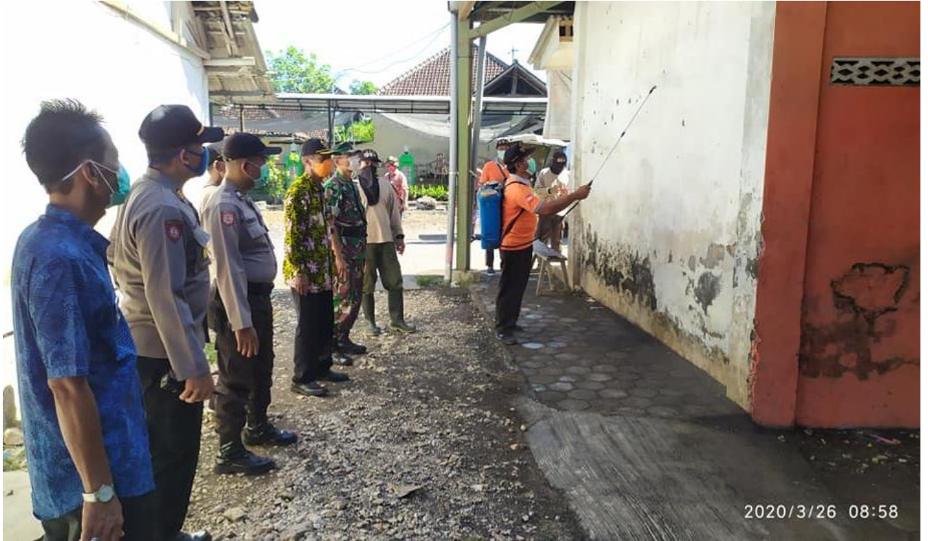
Penyemprotan Disinfektan dilakukan bersama Forkompimca Rowokangkung Di Pasar Sidorejo